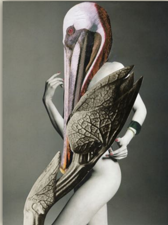
Prends un petit poisson – janvier 2018

Le titre de chaque collage est une référence à une chanson (généralement française) qui intervient fortement dans la construction narrative de l'œuvre.