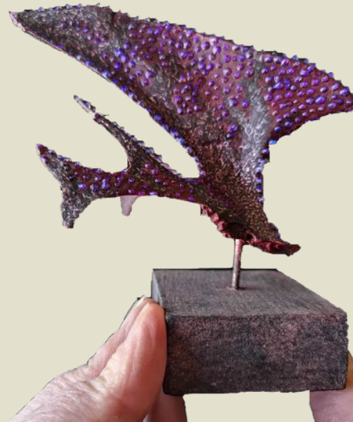
Pintade (crête sternale) cuite et mangée le 09-04-18, pigments