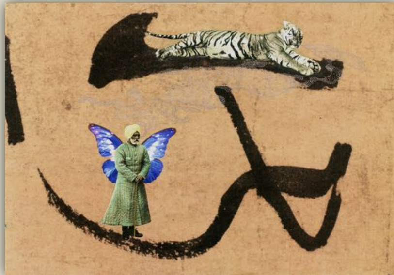
« Signes #7 – Dans les vapeurs de Bombay » - juillet 2018

Les neuf collages de cette série également créée à Shanghai sont conçus à partir de sinogrammes trouvés dans les manuels d'apprentissage de calligraphie. Leur sens demeurant totalement étranger à un regard occidental, seule la forme est ici prise en compte, comme pur élément de composition et motif d'inspiration à l'histoire véhiculée par le collage.