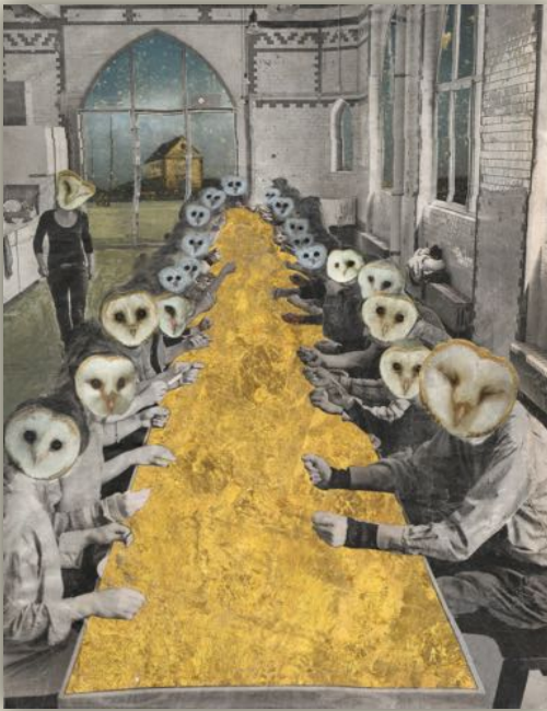
La nuit promet d'être belle – juillet 2016