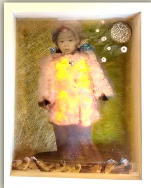
Genius loci #16