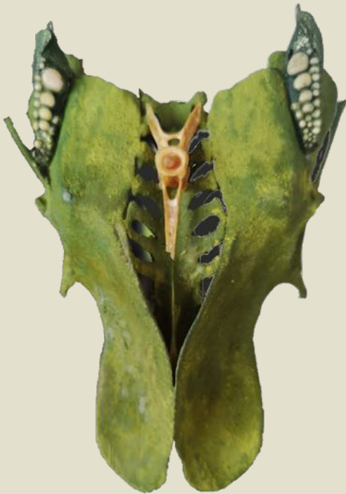
Poulet (pelvis) et daurade royale (mâchoire, vertèbre) cuits et mangés les 29 et 30-04-18

Les OSCULPTÉS proviennent généralement de volailles dont la structure osseuse est peinte et parfois ornée d'éléments tels que mâchoires de poisson, plumes, ailes d'insectes... avant d'être transformée en objet de cabinets de curiosités délicat et mystérieux, évoquant pour les uns un corset, pour d'autres un masque tribal, un animal préhistorique ou un vaisseau futuriste. Ils sont généralement soclés et protégés sous une cloche de verre.