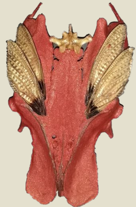
Chapon (pelvis, vertèbre) mangé le 31-12-18, ailes de cigales, pigments