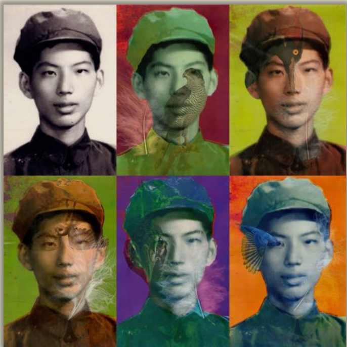
« Ton visage comme un paysage #4 » - janvier 2019

Cette série en écho à Andy Warhol naît d'une ancienne photographie anonyme chinoise à Shanghai, et qui sert de matrice à la série. Cinq variations colorisées puis imprimées sur des feuilles de papier transparent de couleurs et d'opacités différentes viennent compléter cette matrice et modifier le portrait initial, tout en créant une impression de profondeur et un léger flou. Entre deux épaisseurs de papier sont glissées des images découpées ou d'autres éléments qui modifient la composition et l'expression du visage originel. La série compte à ce jour quatre occurrences.