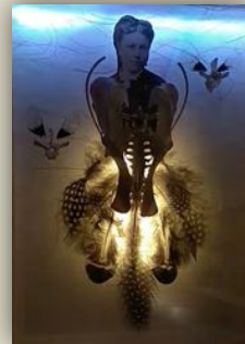
Les Hippocampes #2 – décembre 2018