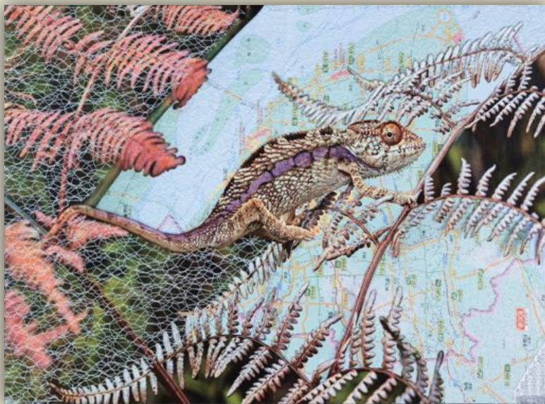
« Lost in translation #1 – To melt oneself into the set – Se fondre dans le décor » - juin 2018

Cette série de sept collages a été réalisée en résidence d'artiste au Swatch Art Peace Hotel de Shanghai en juin 2018. Son titre évoque la déstabilisation éprouvée à l'arrivée dans un environnement assez radicalement différent. Chaque titre est composé d'une expression française et de sa traduction littérale, donc incompréhensible (lost in translation) en anglais (le chinois demeurant pour sa part irrémédiablement étranger).