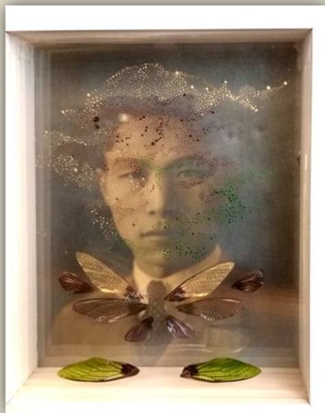
Genius loci #12

Les GENIUS LOCI veillent sur les lieux qui les accueillent. Ces esprits bienveillants présentés dans une boîte lumineuse mêlent photographie ancienne, peinture, collages et ailes de cigales, symbole de renaissance ou d'immortalité dans la culture chinoise. Chaque modèle est unique. Ces petits autels sont composés d'une ancienne photographie insérée dans une boîte lumineuse et de plusieurs feuilles de plexiglas espacées entre elles auxquelles sont ajoutées de la peinture, des collages et des ailes de cigales trouvées dans les parcs de Shanghai. En raison de son étonnant cycle de vie (la nymphe vit sept années sous terre avant de muer et de vivre quelques semaines, le temps de la reproduction, dans un arbre) la cigale est dans la culture chinoise symbole d'immortalité et de résurrection. Durant la dynastie Han, une cigale de jade posée sur la langue des défunts les accompagnait dans leur voyage vers l'au-delà. Les Genius loci existent en trois formats, 21 x 16,5 x 5,5 cm, 27 x 22 x 7,5 cm et 31 x 23 x 5,5 cm ; alimentées par batterie externe ou secteur, elles disposent d'une télécommande et leur éclairage est modifiable (ainsi que leurs couleurs pour les plus grandes). La série se diversifie désormais avec des photos de famille (boîte personnalisée sur commande).