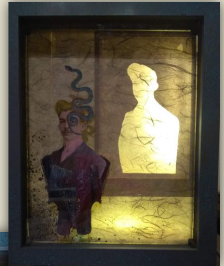
Les Hippocampes #3 – décembre 2018