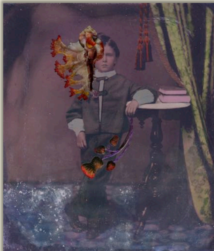
« Mémoire des autres #4 – La compagnie des Diatomées » - février 2019

Cette série part de ferrotypes anonymes du XIX ème siècle scannés, imprimés, colorisés (peinture, pastels, crayons) et enrichis d'éléments de collage, afin de créer des petits contes plus ou moins mystérieux, plus ou moins inquiétants, qui génèrent un contrepoint au hiératisme propre à la pose du modèle dans l'atelier du photographe.