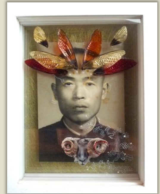
Genius loci #15 - août 2018