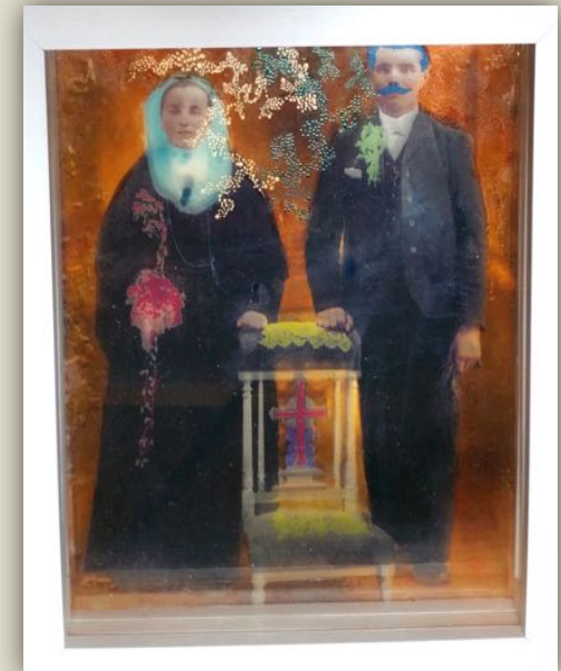
Genius loci #19