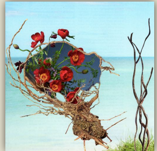
Je voudrais toujours te plaire – décembre 2017