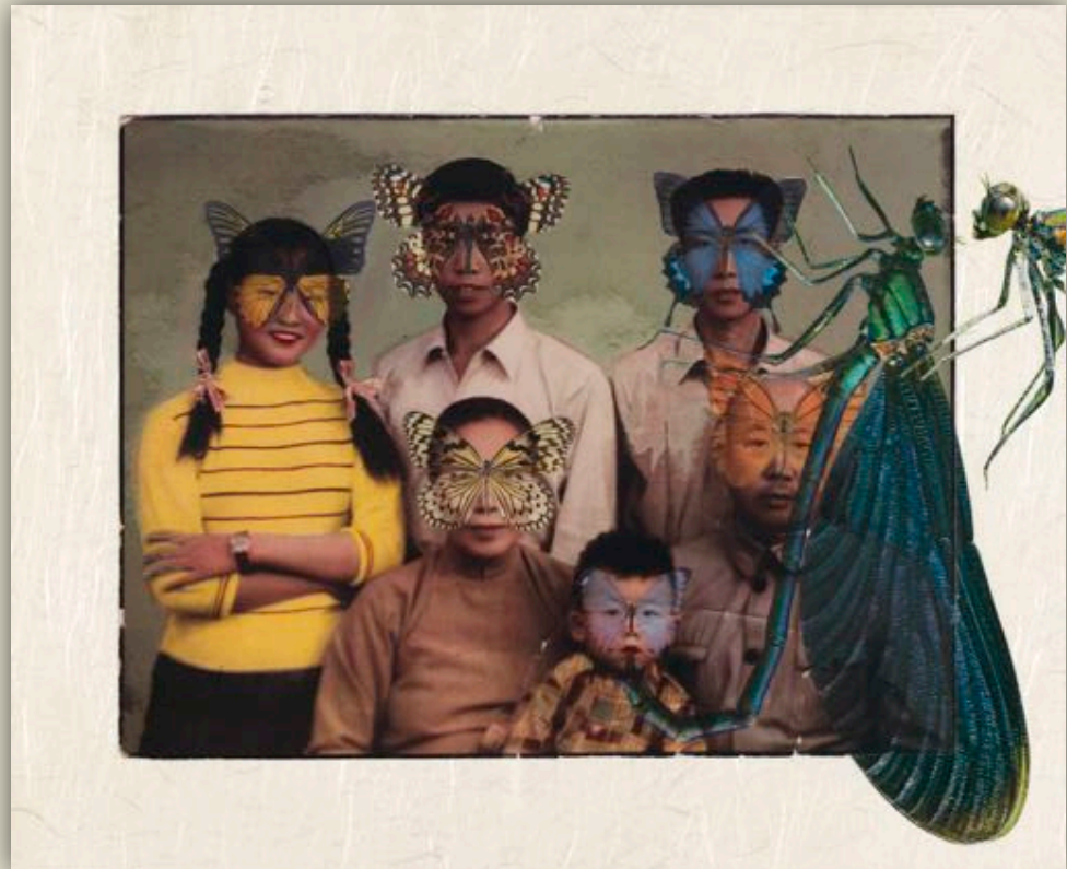
Transparitions #5 – octobre 2018

Dérivée des Genius loci (voir infra), les «Transparitions » mêlent photographies anciennes dénichées à Shanghai et images découpées intercalées entre la photographie et une impression de celle-ci sur papier transparent. Il résulte de cette superposition une impression de profondeur, ainsi que d'hybridation entre l'humain de la photographie et les animaux des collages. La série compte à ce jour six œuvres.