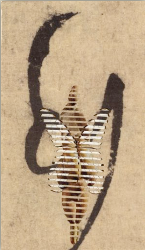
« Distorsions #2 – Un papillon dans le ventre » - juillet 2018

Deux images découpées en fines bandes régulières s'intercalent pour générer une nouvelle composition aux formes étirées, déformées, distordues. Les trois premiers collages de cette série ont également été réalisés à Shanghai.